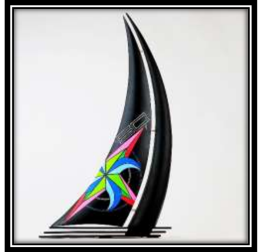
Arnaud Régalet « FIFTY WINDY » @Arnaud_regalet