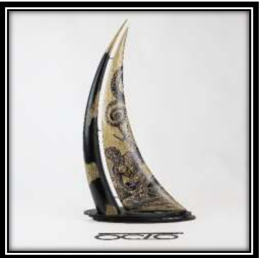
Ludwig « ATLANTIS » #idylliktattoo @idylliktattoo