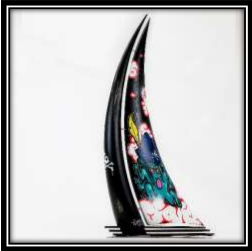
Daddytwoer pour « PUS »