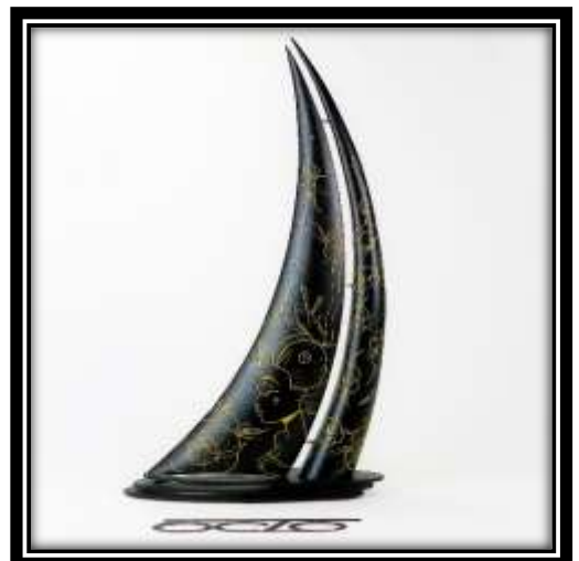
Zil Innk « HENNYA » @zil.innk