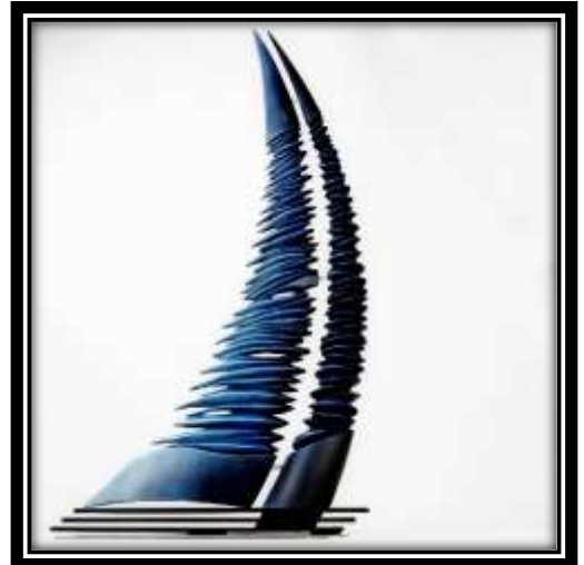
Ludovic Bourgeois « BLIZZARD » @ludovic_bourgeois