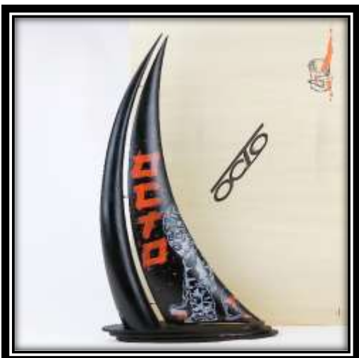
Renaud « DRAWINGMAN » @renz_93100